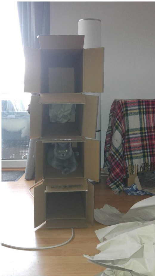
wie verrückt liefen alle durch die Wohnung und riefen meinen Namen... ein richtiges Spektakel :D