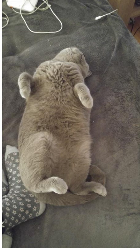
Moezas Lieblingsbeschäftigung & Simbas Wohlfühlposition